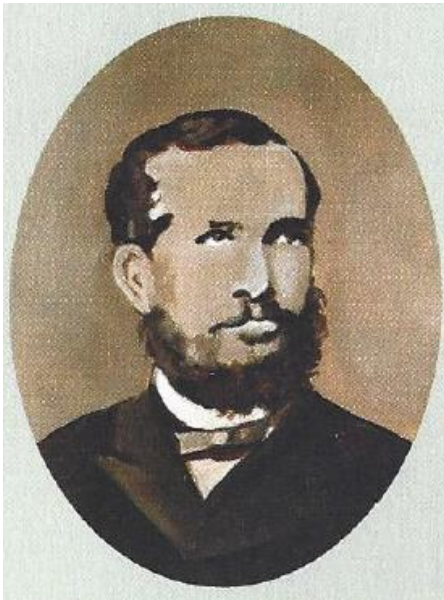
“Conde de Parnaíba”

A formação do município de Conchal teve início em 1906, em terras pertencentes às fazendas Nova Zelândia, Ferraz e Leme, que constituíram dois núcleos coloniais distintos: “Visconde de Indaiatuba” e “Conde de Parnaíba” , ambos criados em 28 de março de 1911.