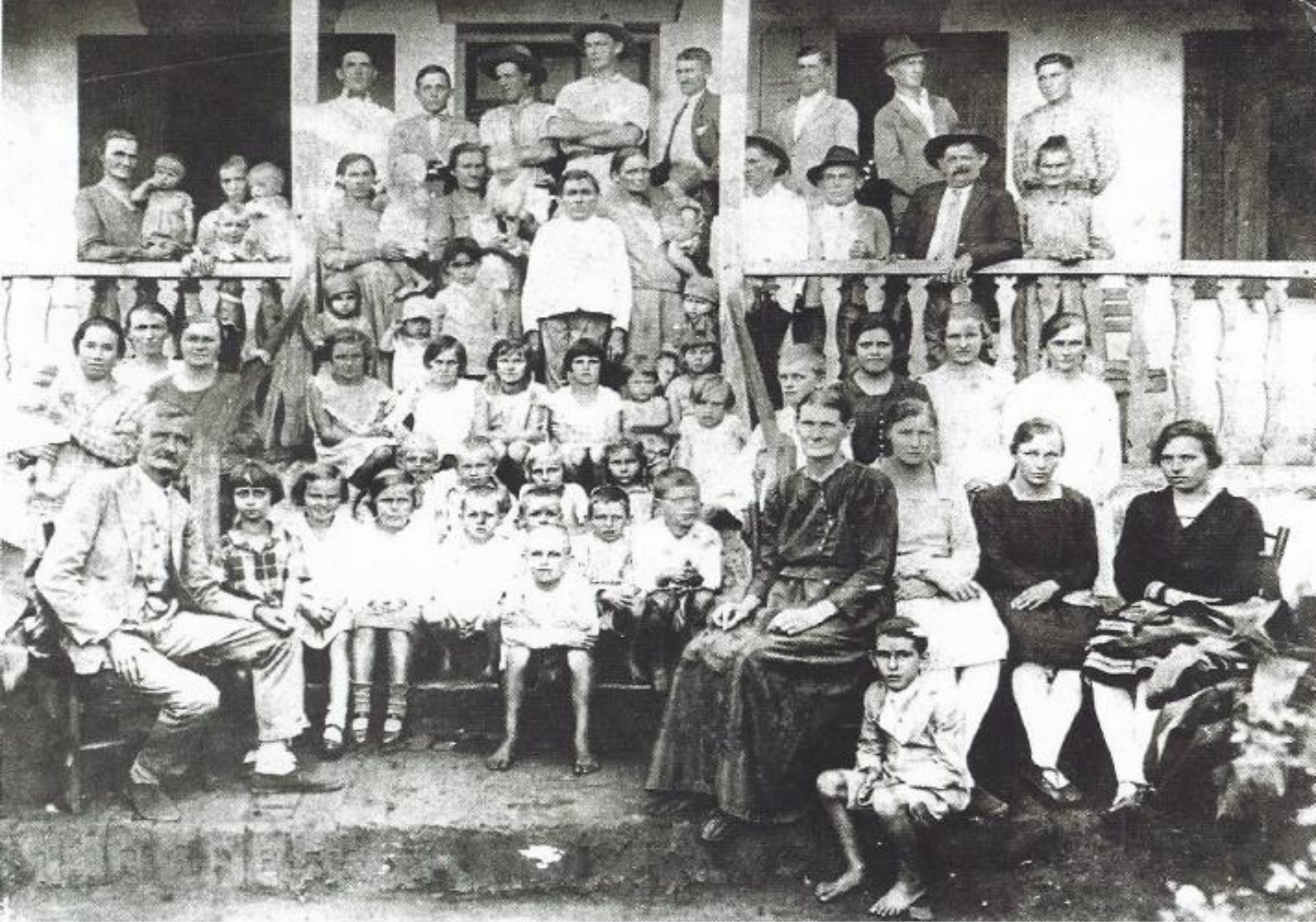
A primeira família de alemães em Conchal.